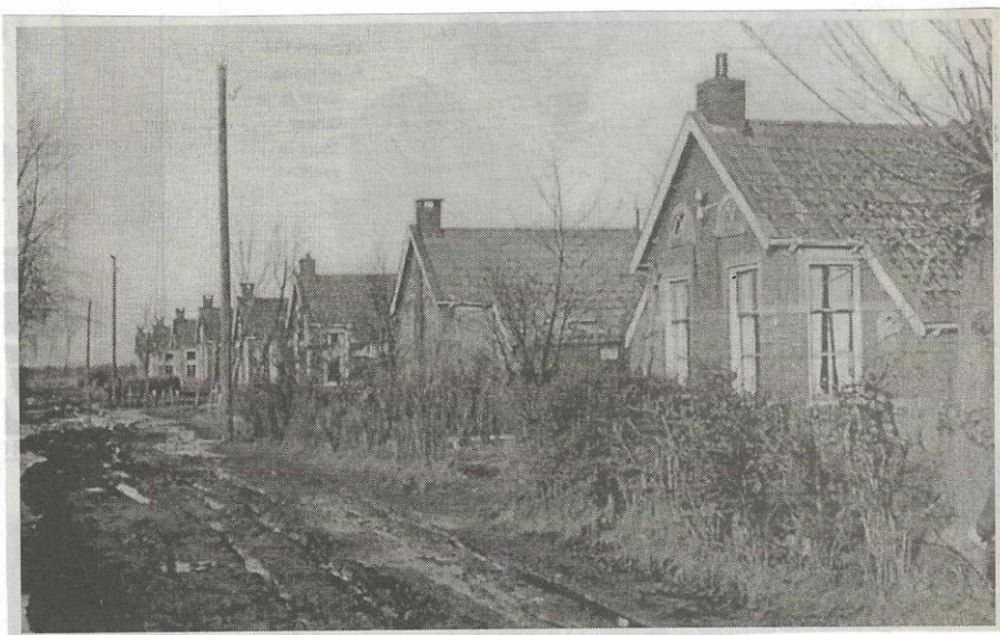
Woningen De Bosk 20 t/m 34 te Harkema, afgebroken in 1967. De foto werd een jaar eerder genomen, waarop onder andere is te zien dat de weg nog onverhard was. Eigenaar: Stichting Woningbouw in de gemeente Achtkarspelen. Op deze plek is nu het sportveldencomplex 'De Bosk'.