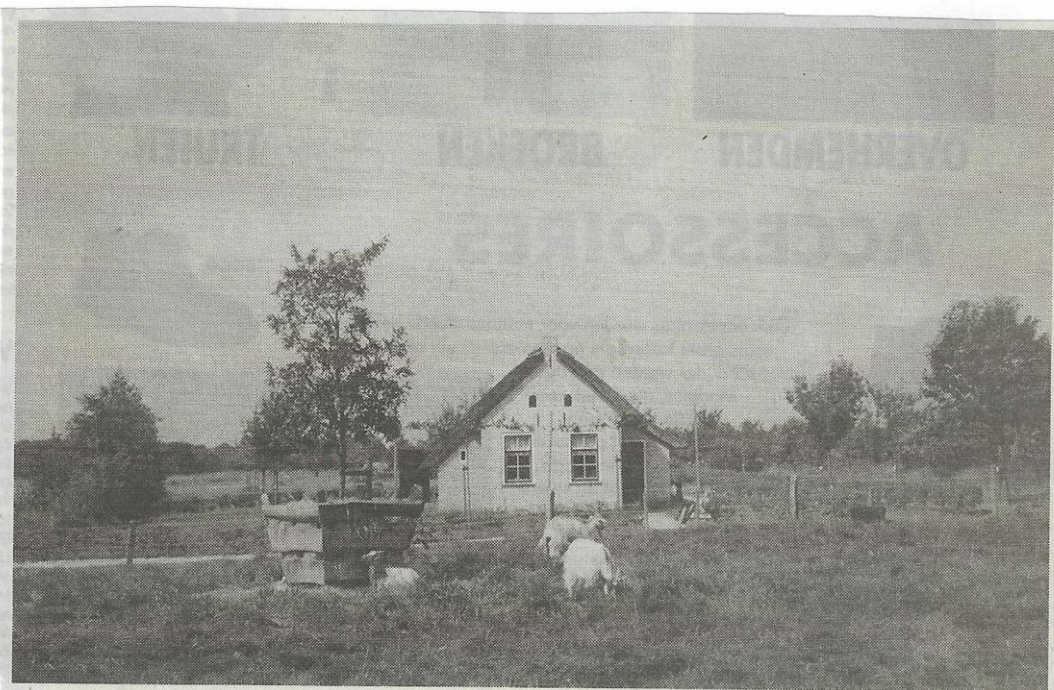
Woning in 2001 op het Themapark te Harkema.