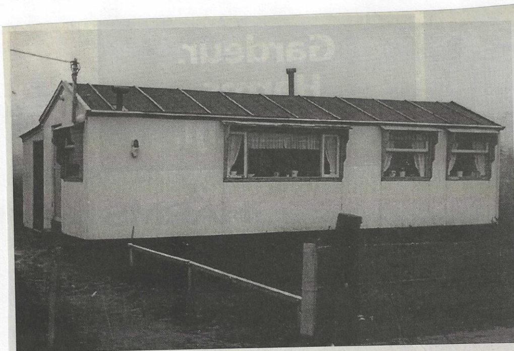
Salonwagen gebruikt als noodwoning aan de Wopkeloane 9n, Harkema, plm. 1965.